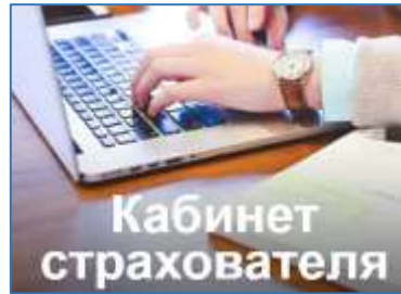
ЛК -статус реестра и выплаты