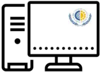
АРМ СЗН ФСС