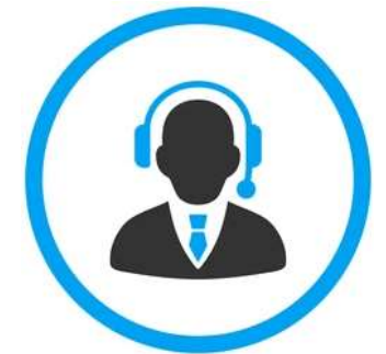
Персональный менеджер ФСС

+ Страхователь может подать жалобу в личном кабинете ФСС