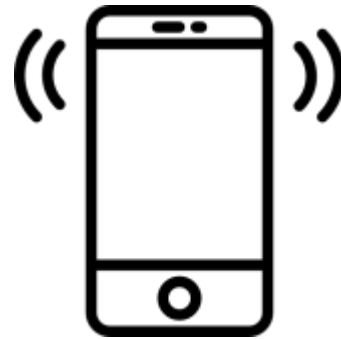
Горячая линия Фонда